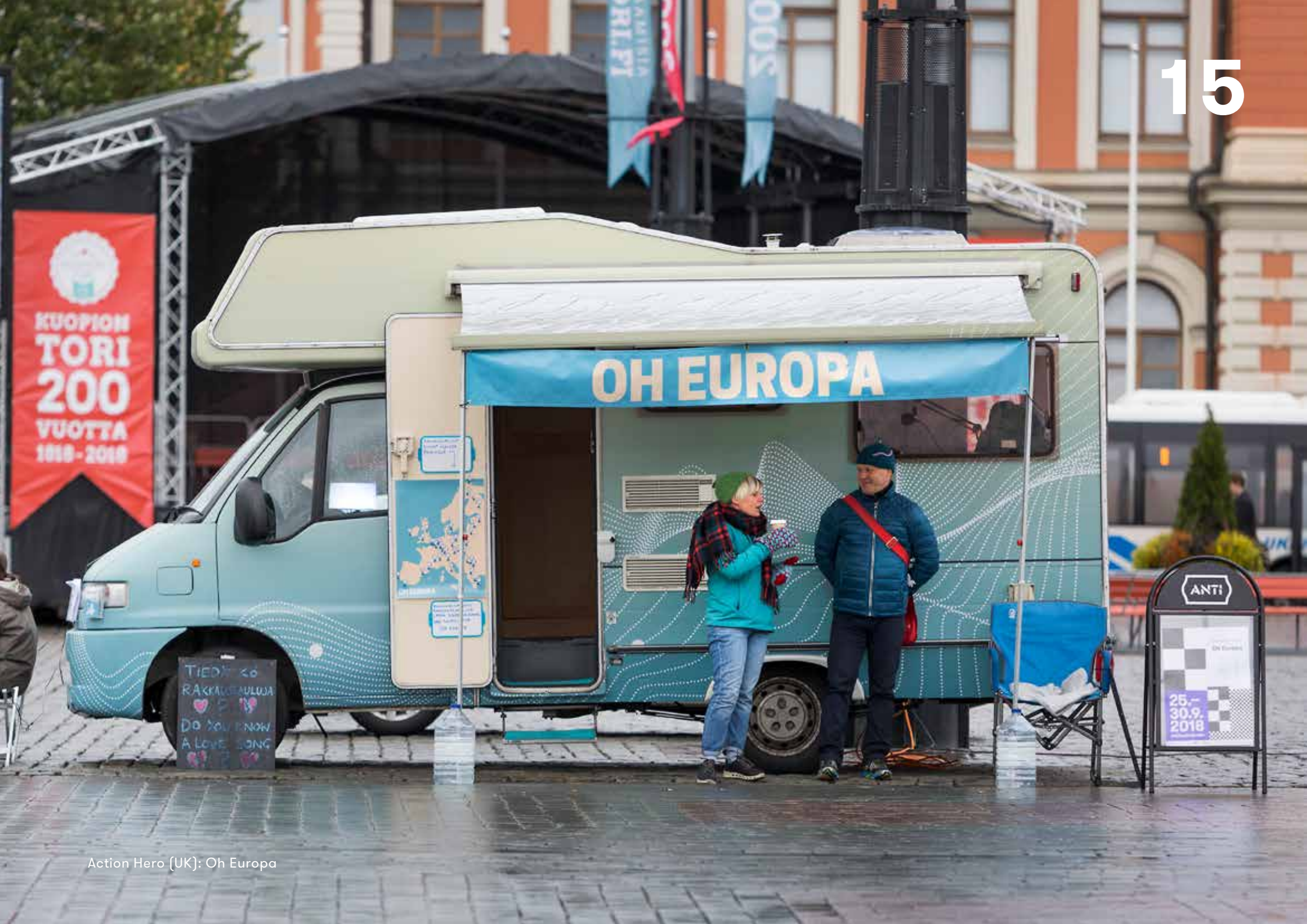
Action Hero (UK): Oh Europa