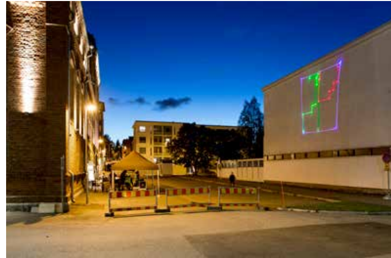
Meetlab (HU): TRON