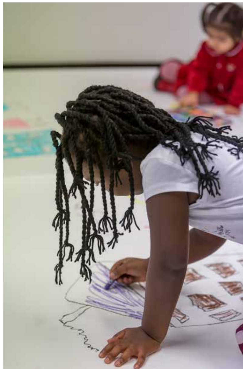
POMPPU - pop-up-taidetta maahanmuuttajille -hanke