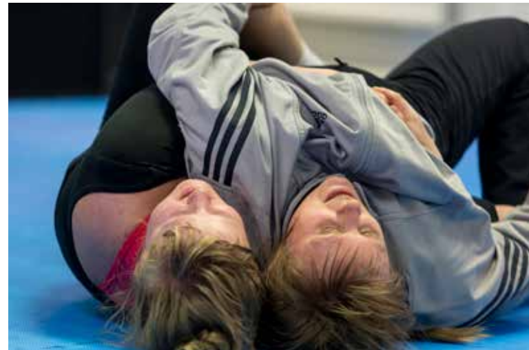
Painikerho / Wrestling Club (FI)