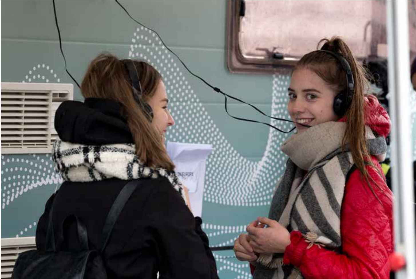
Action Hero (UK): Oh Europa