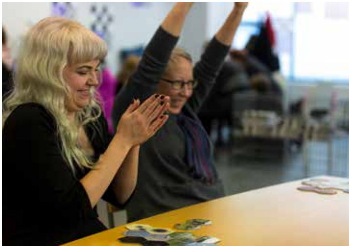
point and place (UK etc): Hexagons