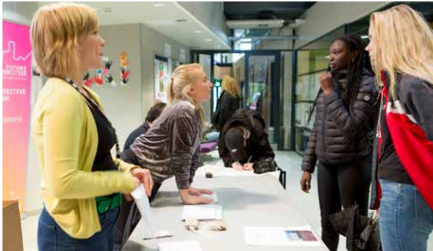
Future DiverCities Lab