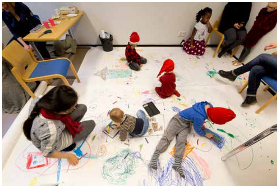
POMPPU - pop-up-taidetta maahanmuuttajille -hanke