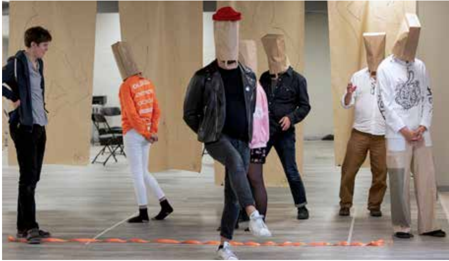
Future DiverCities Lab