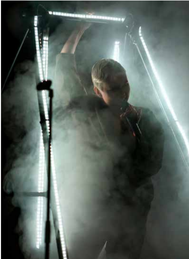
F ANTI Prize Partyssa