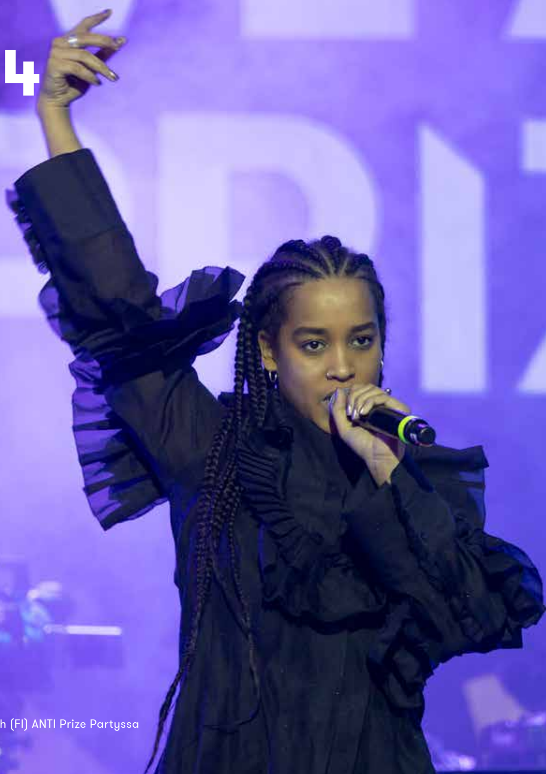
Yeboyah (FI) ANTI Prize Partyssa